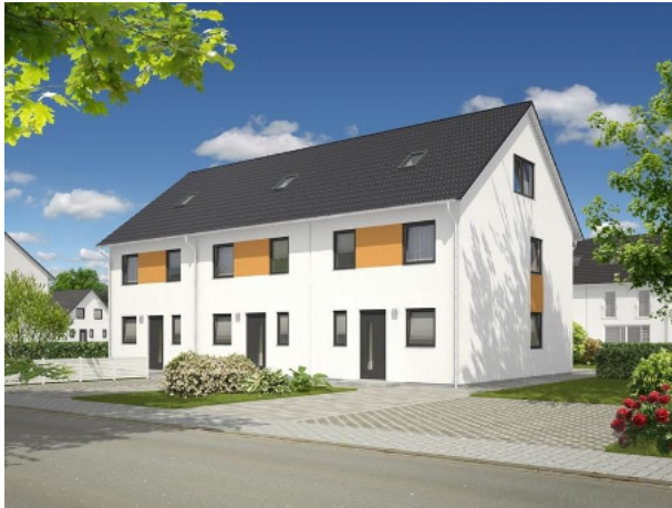
Ansichtsvariante Reihenmittelhaus Mainz 128