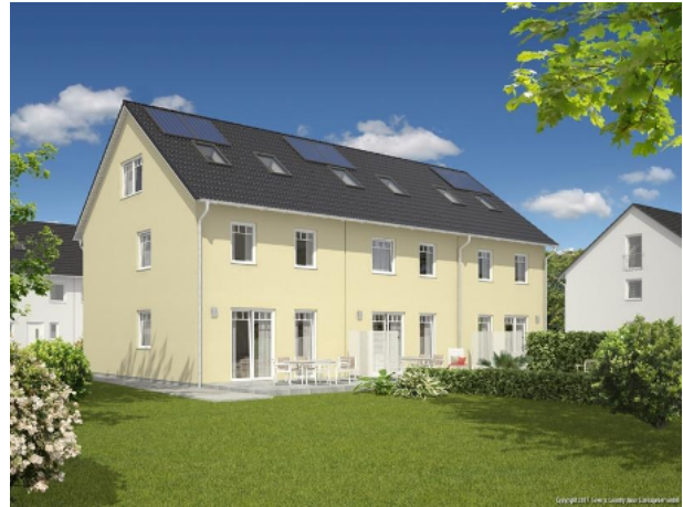
Ansichtsvariante Reihenmittelhaus Mainz 128