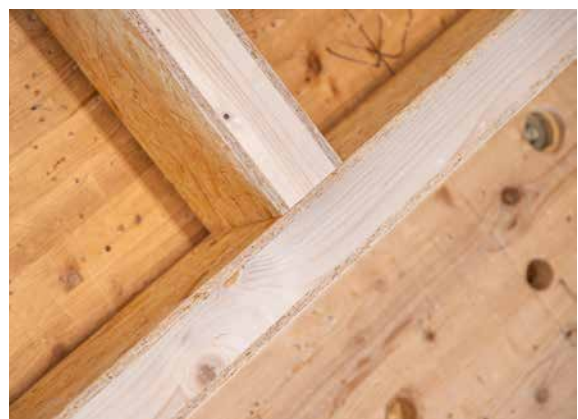
Die EGGER EcoBox in der Vorfertigung von Holzrahmenbauwänden.