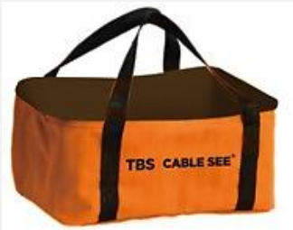
Bolsa Cable See (100 unid)