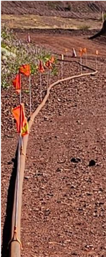
FMG – Solomon Pruebas