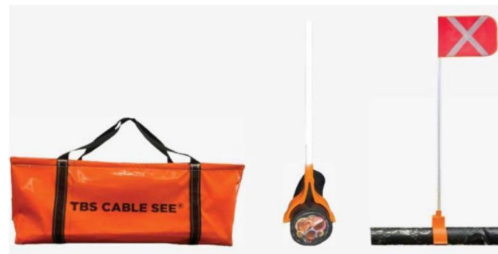
Bolsa almacenaje y transporte Vista de lado Vista frontal