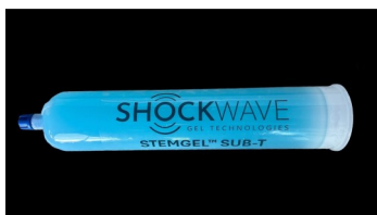
Listo Para Ocupar STEMGEL™ SUB-T Cartucho