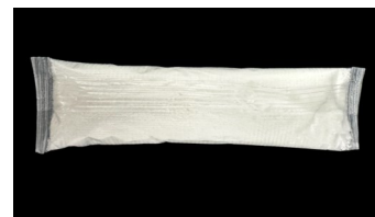
STEMGEL™ PAK - 10g Paquete Disoluble