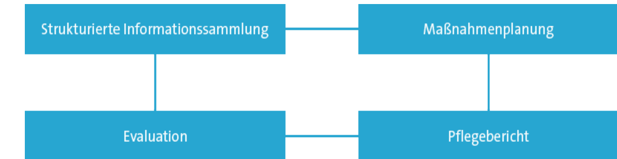
Abb.: Pflegeprozess nach dem neuen