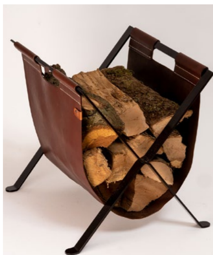
(photo de droite) X-Basket, pour conserver du bois, des journaux, des plaid ou autres.