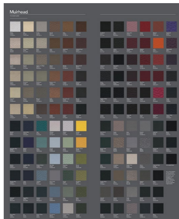
Nouvelle fiche de couleurs Muirhead

Comme déjà signalé l'année dernière, certaines modifications ont été apportées à la collection cuir de Muirhead. La nouvelle fiche couleurs est disponible auprès de nous. Pour les articles CALEDONIAN, GRAMPAN, SATEEN, METALLIC et Lustrana, certaines couleurs ont été en partie retirées du programme et partiellement remplacées par de nouvelles. Le cuir CAIRNGORM correspond à l'ancien cuir INGLESTON. Mais le nom n'est pas le seul à avoir changé... Le grain et le fini du cuir aussi ont été modifiés.