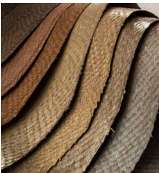
Cuirs de poisson SAUMON

La tannerie Atlantic Leather a repris ses activités sous une nouvelle direction. Les nouveaux propriétaires produisent du cuir de poisson sous le nom NORDIC FISH LEATHER . Nous sommes d'autant plus heureux de vous annoncer que les peaux de cuir de poisson sont dès à présent de nouveau disponibles. La tannerie se concentre désormais sur la production de cuirs de poisson SAUMON, CABILLAUD et LOUP.