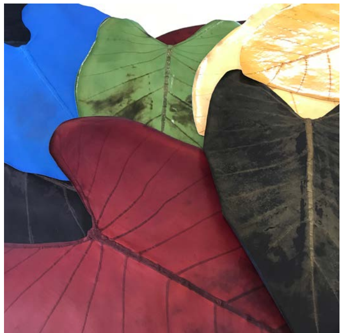
Feuilles de beLEAF™ (photo en bas)