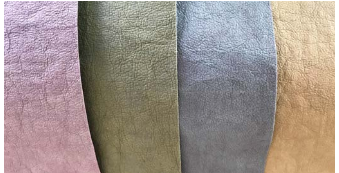
Matériau cellulosique bien connu JACROKI (photo du haut)

Pour plus d'informations sur les articles individuels, visitez notre site Internet ou contactez-nous.