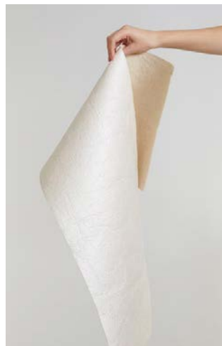
Matériau Piñatex® (photo du haut)