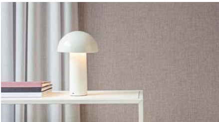
Tissus DELIMAR collection Meridian (photo du haut)