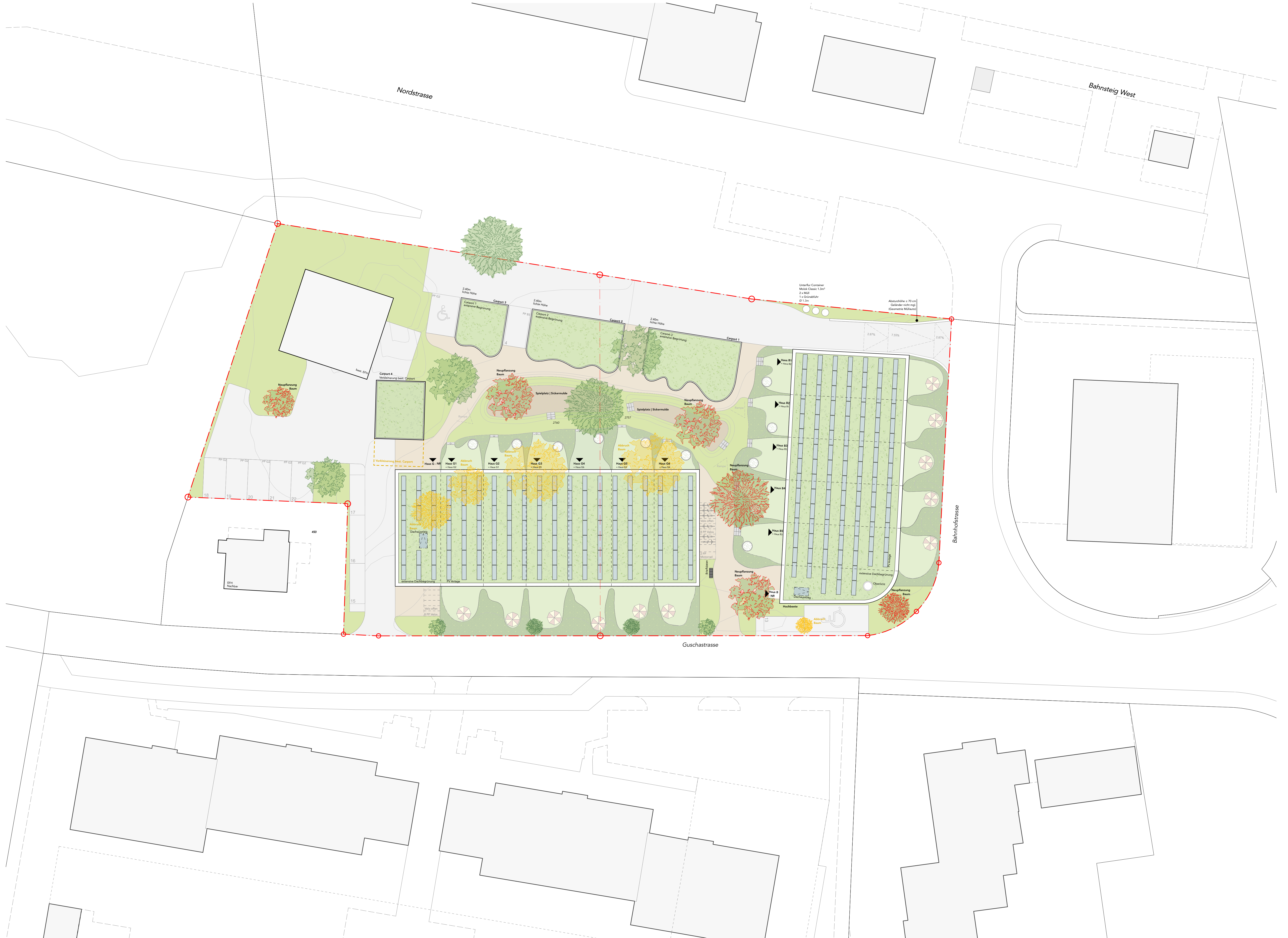
Dachansicht | Umgebungsgestaltung M 1:200