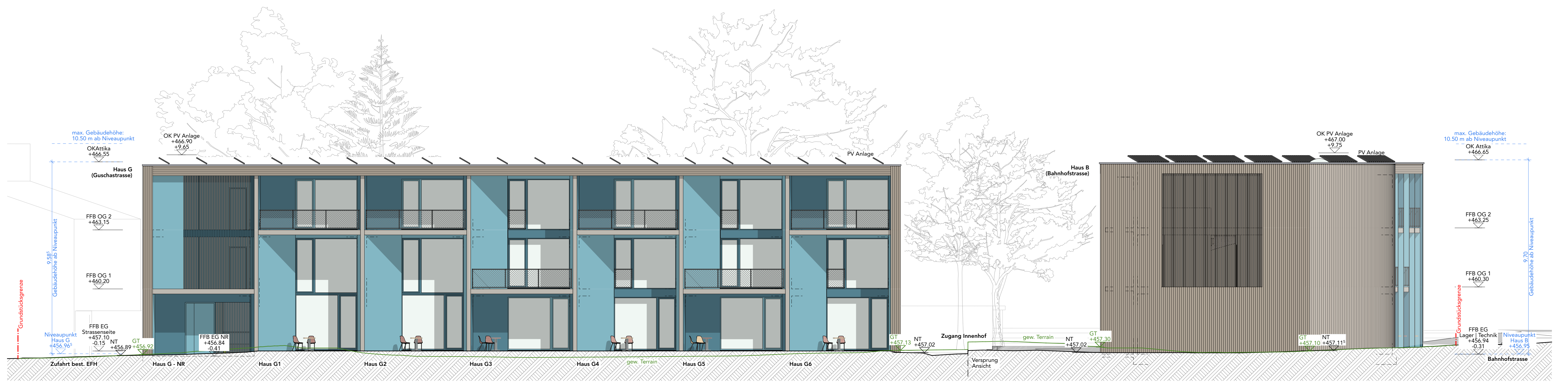
Ansicht West | Haus G von Guschastrasse M 1:100