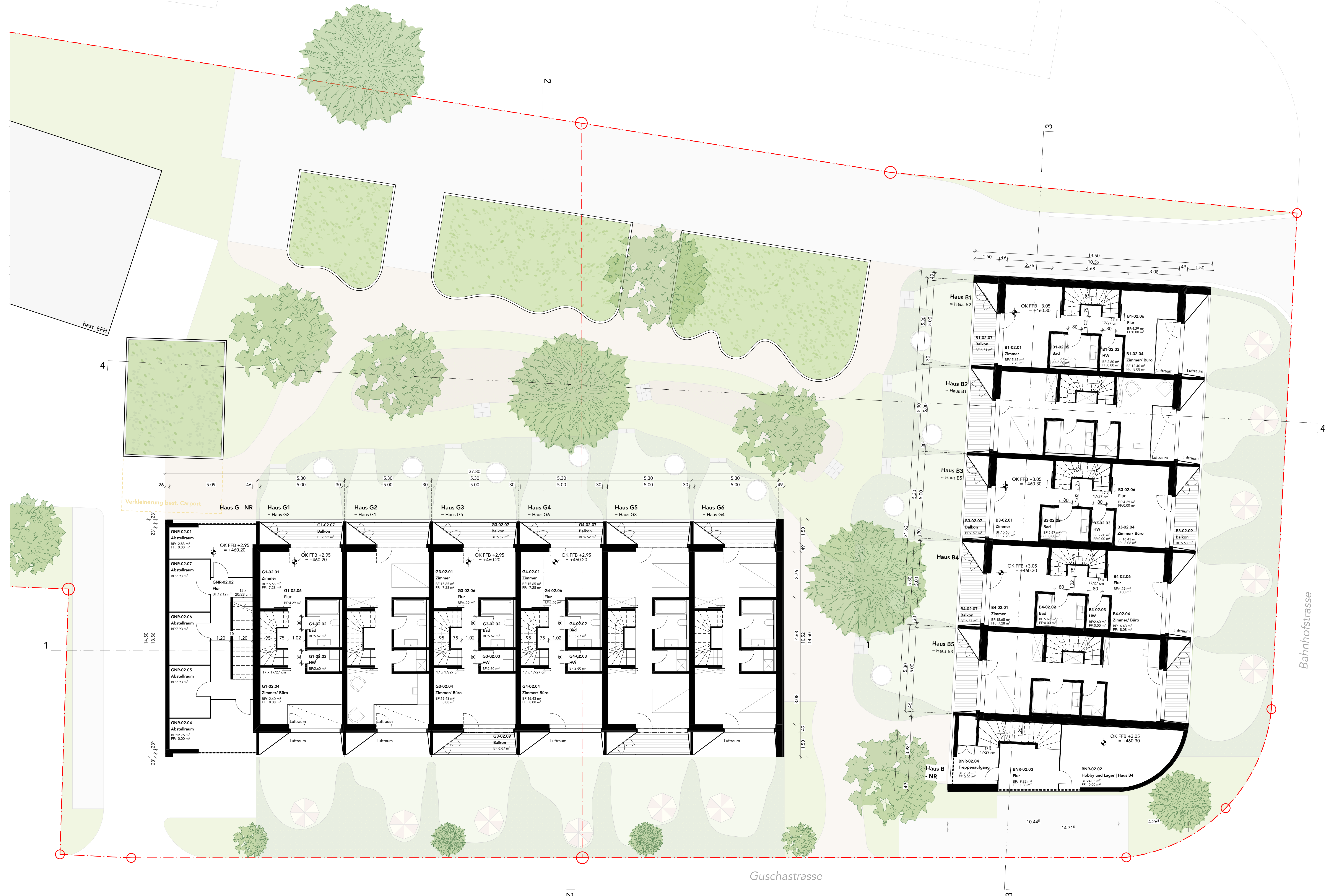
Grundriss | 1. Obergeschoss M 1:100