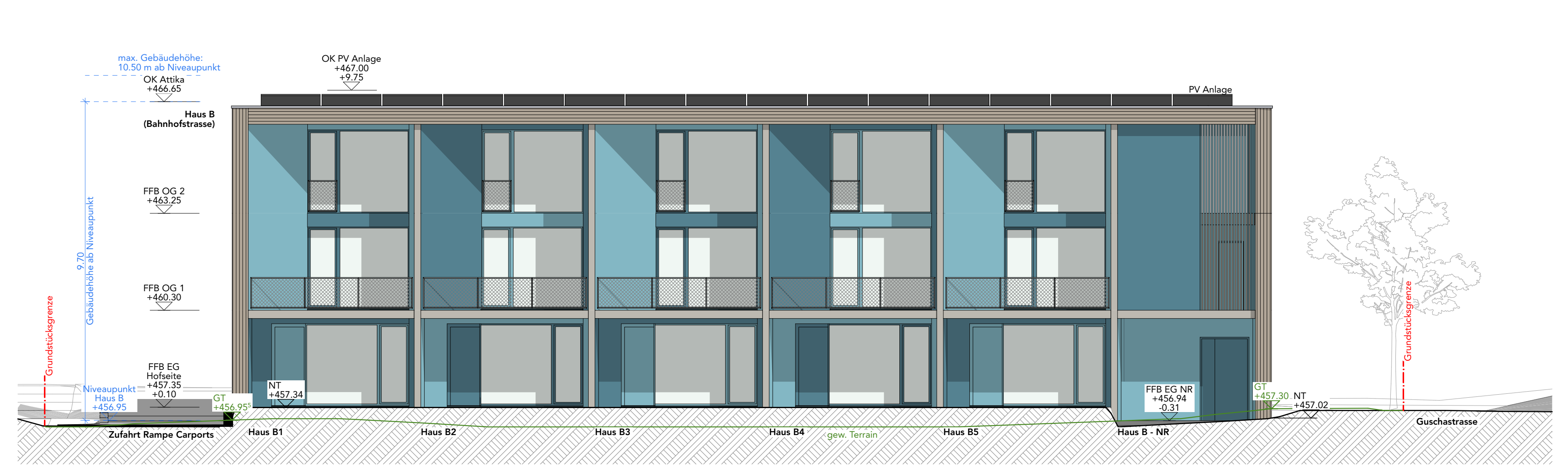
Ansicht Nord | Haus B Hofseite M 1:100