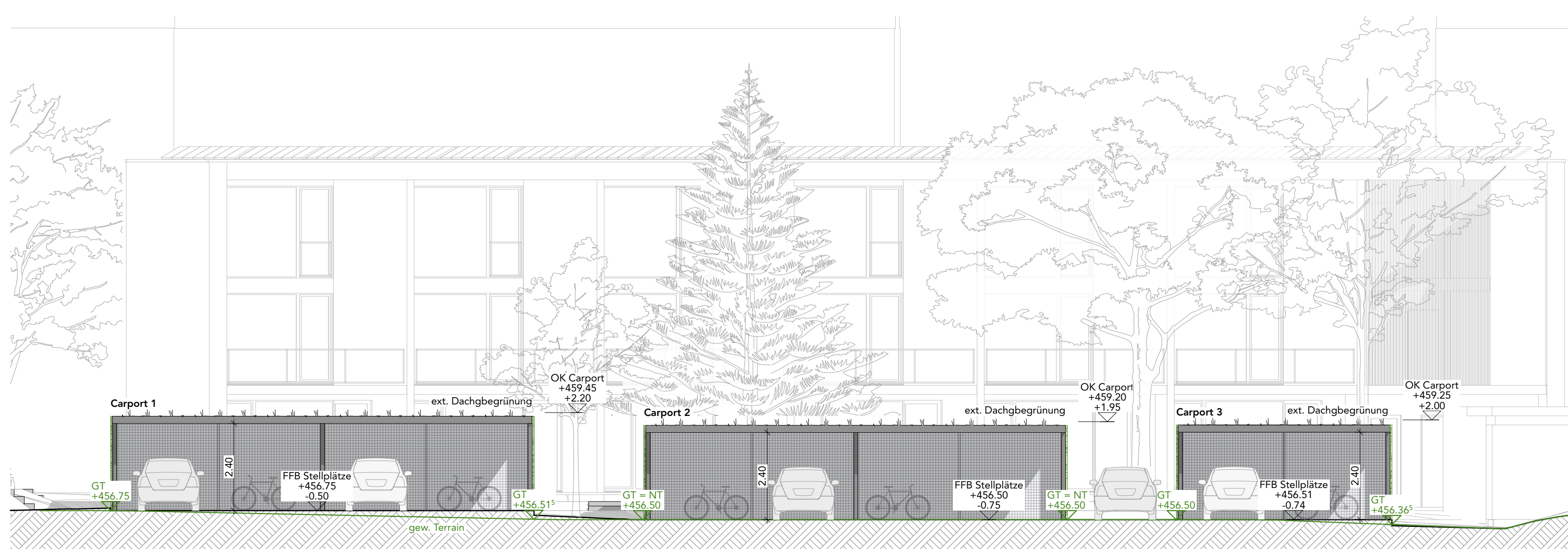
Ansicht Ost | Carport 1-3 M 1:100