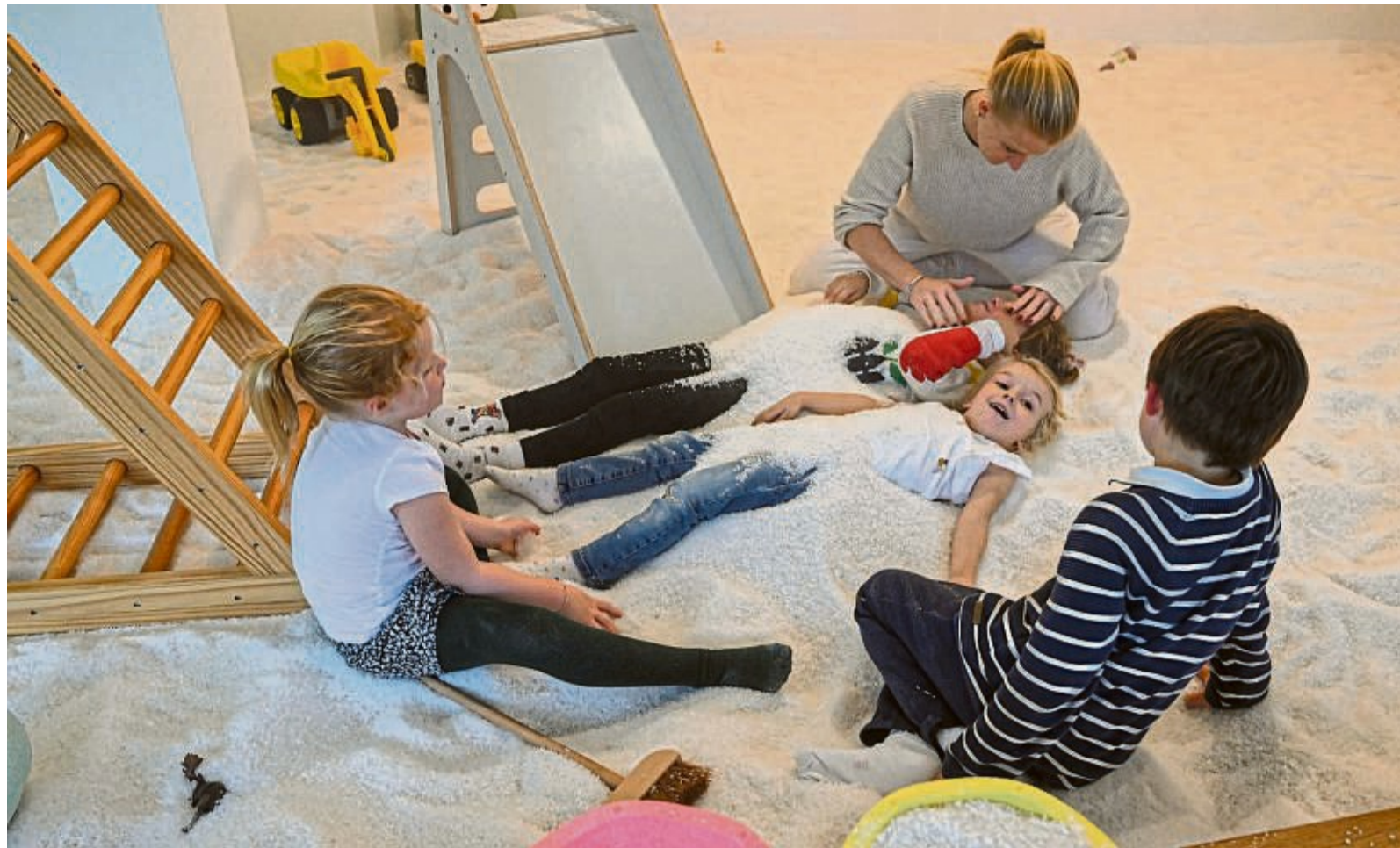
Gut gepökelt. Vier Tonnen Salz bedecken den Boden des Innen-Spielplatzes in der Hedderichstraße.

Der große Leuchtturm an der Fassade des Gebäudes Hedderichstraße 43b weist den Weg: Seit zwei Wochen ist das „Salzspiel“ geöffnet, ein Indoor-Spielplatz der besonderen Art. Die Spielfläche ist nicht mit Sand, sondern mit Salz aus dem Mittelmeer gefüllt. Durch eine Wand mit Salzkacheln leuchtet sanftes Licht, und aus einem Vernebelungskasten wird beständig Salzsole in den Raum gepustet.