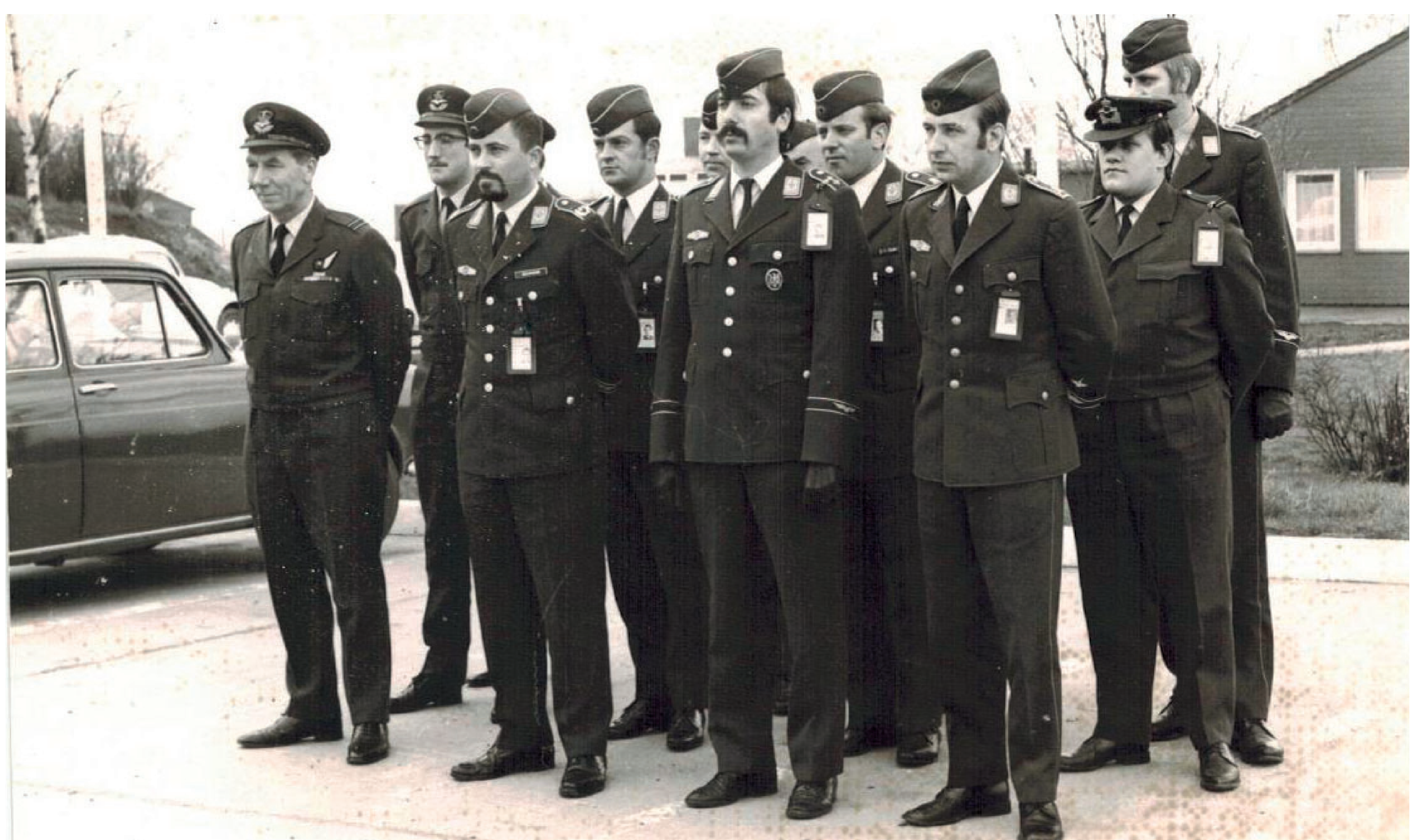
NATO-Soldaten aus den drei Nationen Großbritannien, Holland und Deutschland