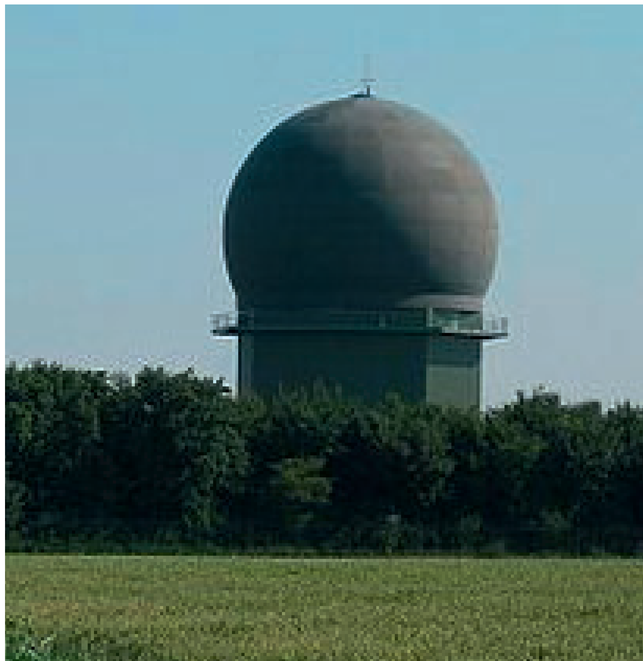
1971 3D-Radar Medium Power Radar (MPR)