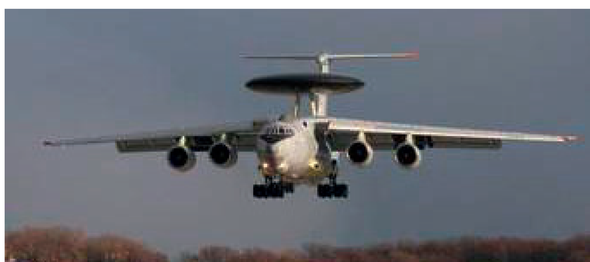
Fliegende Radarstellung AWACS E3A