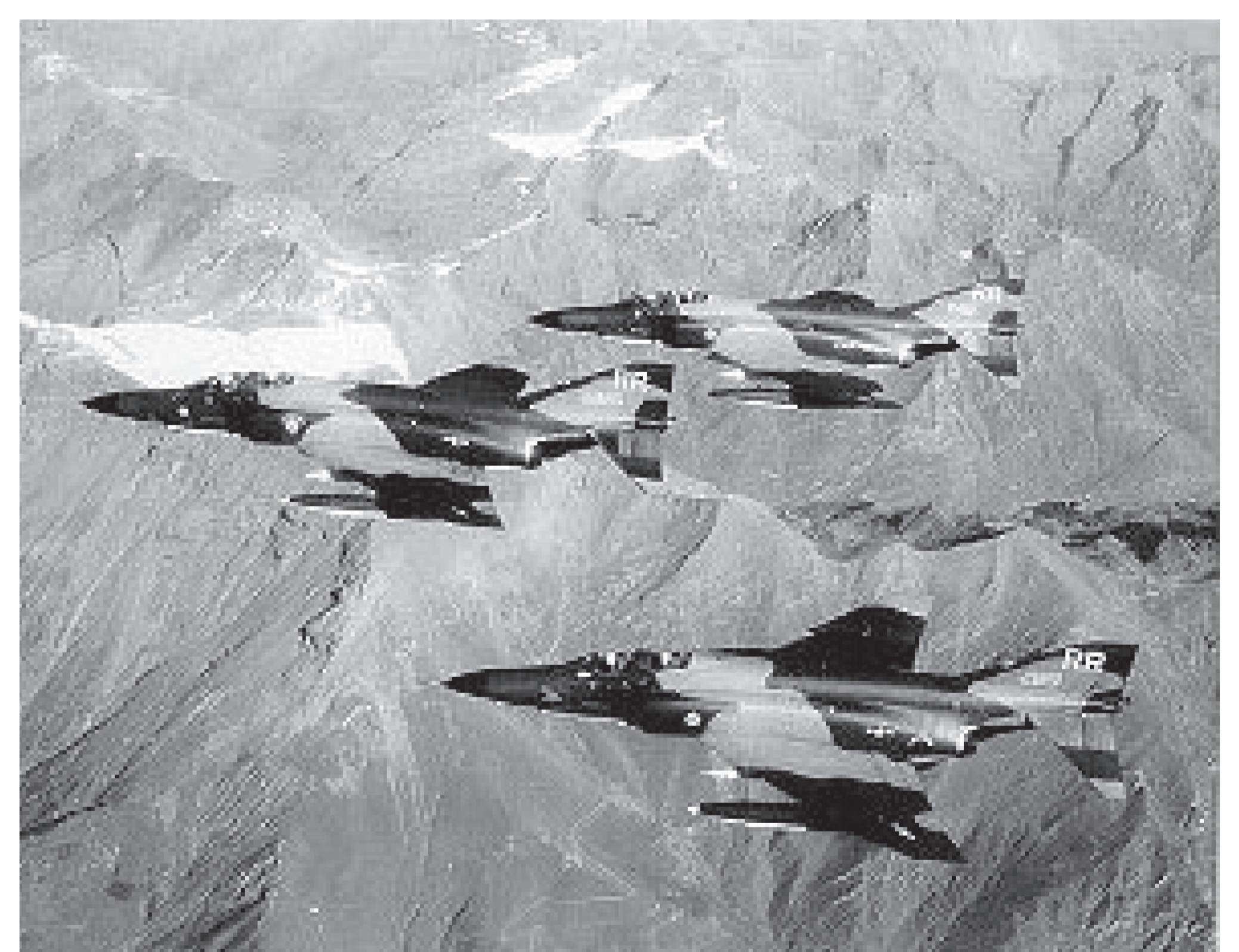
F4-Phantom-Abfangjäger der NATO