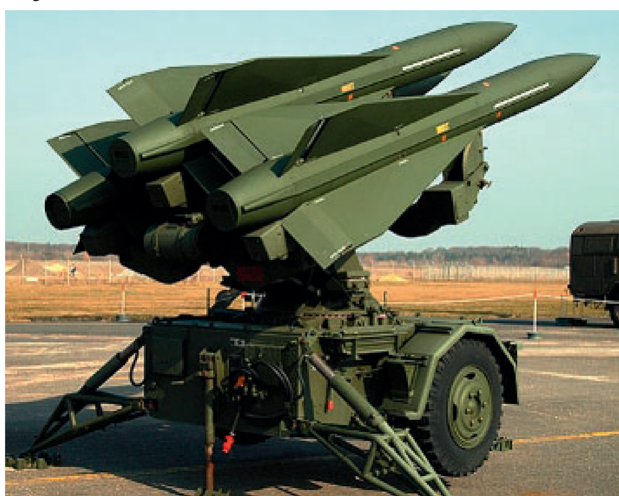
Tiefflugabwehrraketen HAWK der NL