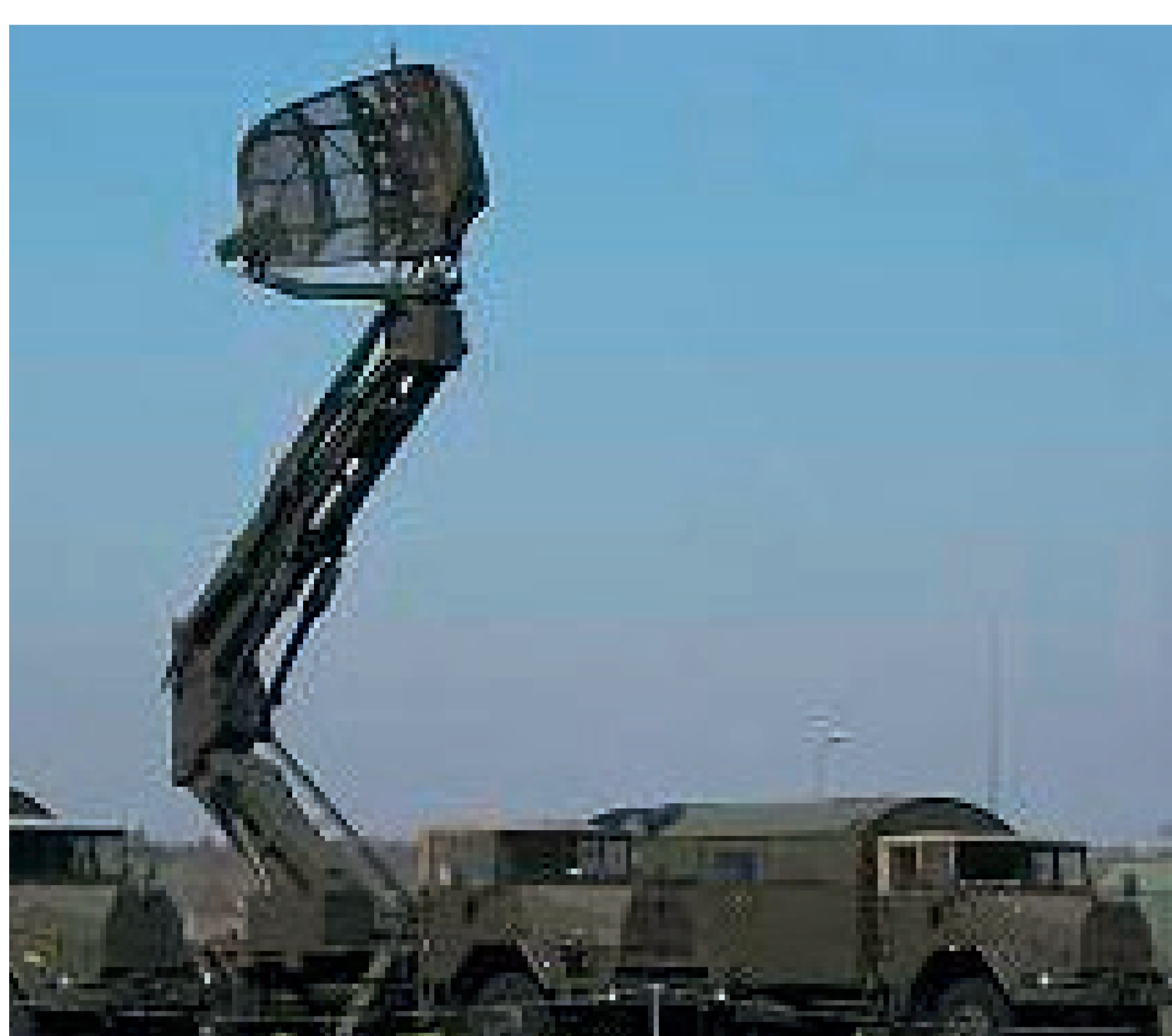
Mobiles Tiefflieger-Melderadar MPDR