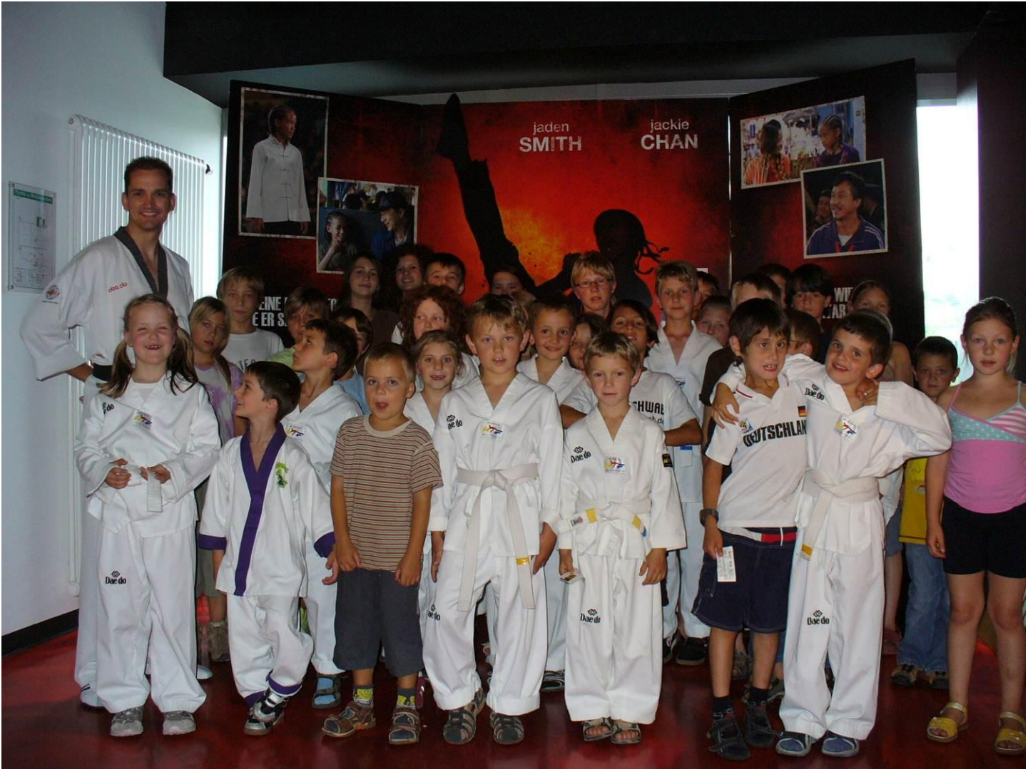
28. Aug – 04.Sep -XV. Taekwondo-Powercamp in Kroatien