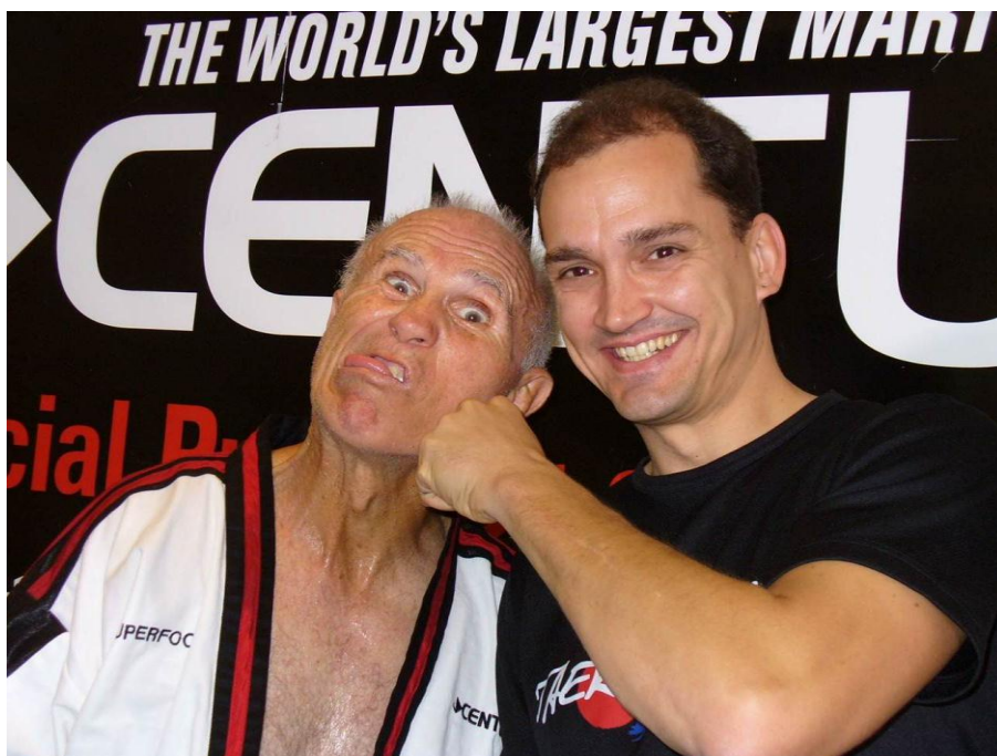
„Superfoot“ Bill Wallace