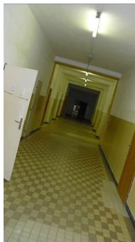
Der Horror - Flur

Wir lebten wie Soldaten! Im „Krieg“, gibt es keine guten Unterkünfte!