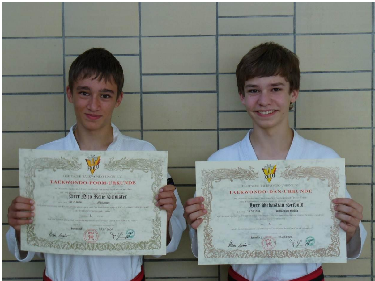
Abschlussfeier der Danprüflinge in der Gaststätte „Stern“ in Mittelbronn! Zu diesem besonderen Anlass durften wir in den „Geisterkeller“!