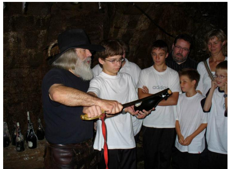
Die Zwei durften mit dem Säbel eine Champagner - Flasche öffnen!