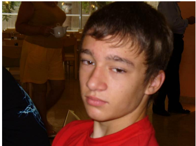
Das Training hinterlässt seine „Spuren“