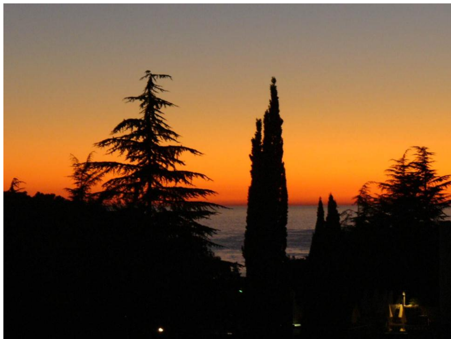
Sonnenuntergang vom Hotelzimmer