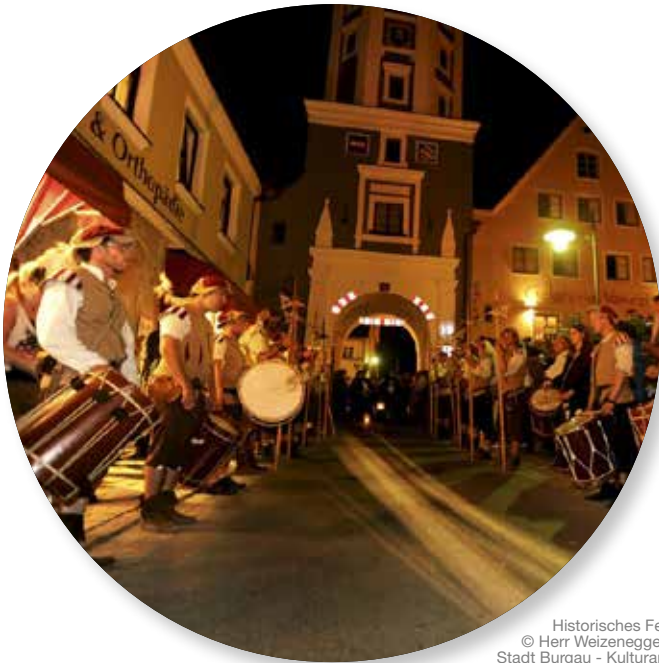
Historisches Fest