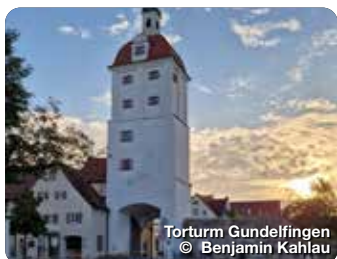
Torturm Gundelfingen

Entdecken Sie die lebenswerte Vielfalt an der Donau. Die Stadt Gundelfingen a.d. Donau hat mit den Stadtteilen Peterswörth und Echenbrunn über 8.000 Einwohner. Das Stadtbild ist geprägt vom Mittelalter und erhielt im Jahr 1220 die Stadtrechte. In dieser Zeit wurde die schützende Stadtmauer mit drei Toren errichtet, von denen heute noch das „Untere Tor“ erhalten ist und ein bedeutendes Wahrzeichen der Stadt darstellt. Die Geschichte Gundelfingens lässt sich auf dem Historischen Stadtrundgang erkunden. Eine reichhaltige Palette an Freizeiteinrichtungen, wunderschönen Badeseen und Sportanlagen inkl. einer Wasserkianlage, gut ausgebauten Rad- und Wanderwegen an der Donau und an der Brenz sowie abwechslungsreiche Gastronomie laden zu erholsamen Stunden ein. TreffpunktDeutschland.de/gundelfingen