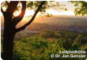
Luitpoldhöhe © Dr. Jan Gensler

Mitten im „Gottesgarten am Obermain“ liegt Bad Staffelstein. Auf der einen Seite erhebt sich das prunkvolle, von den Brüdern Dientzenhofer erbaute, Kloster Banz und gegenüber die barocke Wallfahrtskirche Vierzehnheiligen. TreffpunktDeutschland.de/bad-staffelstein