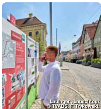
Lauingen, Lauschtour

Schießgrabenstr. 14, 86150 Augsburg, Tel.: 0821 45040110, info@tvabs.de, www.bayerisch-schwaben.de