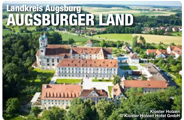
Kloster Holzen

Das Augsburgere Land. Mit seiner reichen Geschichte, seiner vielfältigen Kultur und Landschaft ist das Augsburgere Land ein attraktives Ziel für ein paar Tage Entspannung. Der Naturpark Augsburg - Westliche Wälder ist die grüne Lunge und lädt zum Naturerlebnis und zur Entschleunigung ein. Die Flüsse Lech und Wertach prägen die Landschaft und bieten zahlreiche Möglichkeiten zum Wandern und Radfahren. Ein vielseitiges Kulturangebot und Freizeitspaß sowie familienfreundliche Angebote und Aktivitäten bei abwechslungsreichen Ausflugszielen bieten ein Urlaubsfeeling im Grünen – ganz ohne Trubel.