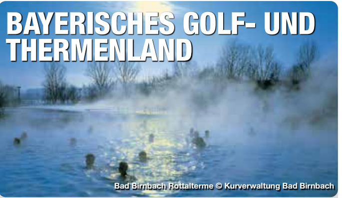
Bad Birnbach Röttalterme

Die Therme empfängt Badegäste in der Wasservelt mit einer großen zusammenhängenden Wasserfläche mit vielen Attraktionen, einer Poolbar, Außenbecken und Sonnenliegewiese. Die Saunalandschaft mit neun Erlebnis- und Themensaunen, einer Schneekammer, Saunagarten mit Thermalwasser-Außenbecken und Ruhebereichen lädt zum Schwitzen und Entspannen ein. Einzigartig ist das Herz des Siebenquell: die GesundZeitReise. Hier spüren Gäste in sieben wunderschönen Badelandschaften alter Kulturen die gesundheitsfördernde Wirkung verschiedener Mineralien. Verwöhn- oder Gesundheitsanwendungen im Medical SPA versprechen eine Extraportion Wellness. Thermalallee 1, Weissenstadt