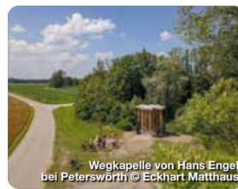
Wegkapelle von Hans Engel bei Peterswörth