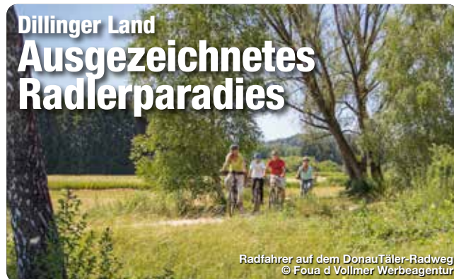
Radfahrer auf dem DonauTäler-Radweg

Am besten lässt sich das vielfältige Dillinger Land mit dem Rad erkunden. Mehr als 15 abwechslungsreiche Tagestouren führen durch den landschaftlichen Dreiklang zwischen Alb, Donautal und Voralpenland – und machen die Region somit zu einem echten Paradies für Radfans. Radlergenuss pur bieten auch die beiden der 4-Sterne-Radwege DonauTäler und Donauradweg. Ein besonderes Highlight ist der Radrundweg zu den Sieben Wegkapellen. Er verbindet auf 153 Kilometern sieben einzigartige Kapellenbauten miteinander – wahre architektonische Unikate und