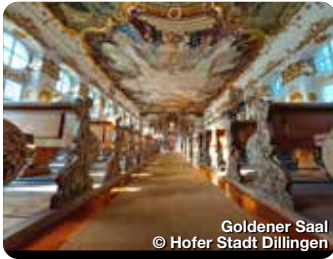
Goldener Saal

Die Große Kreisstadt Dillingen, wegen ihrer Kirchengeschichte und vielen Gotteshäuser auch „schwäbisches Rom“ genannt, schmiegt sich malerisch ans Nordufer der Donau. Ein Rundgang durch die Altstadt führt zu historischen Sehenswürdigkeiten wie dem imposanten Schloss, der Basilika und der ehemaligen Universität. Kulturfreunde, Naturliebhaber und Aktivurlauber kommen nicht zu kurz, denn das Freizeitangebot ist vielfältig: Museen, Kneippanlagen, Konzerte und Theater, bunte Märkte und Open-Air-Events bieten Unterhaltung pur. Der prämierte Donau-Auwald-Wanderweg, idyllische regionale Rad-Routen oder der bekannte Donau-Radwanderweg bieten einzigartige Naturerlebnisse. TreffpunktDeutschland.de/dillingen