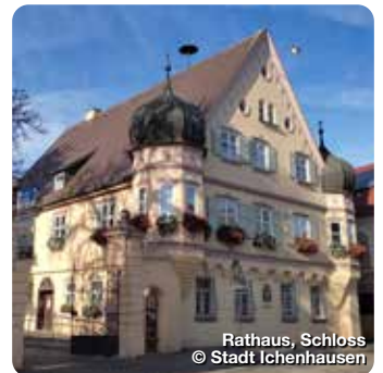
Rathaus, Schloss

Die 1789 neu erbaute Pfarrkirche im Übergangsstil vom Rokoko zum Klassizismus birgt in einem lichten, stimmungsvollen Raum äußerst seltene Fresken von Enderle und Huber. Kirchplatz 8, Burgau