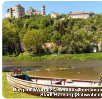
Burg mit Wörnitz