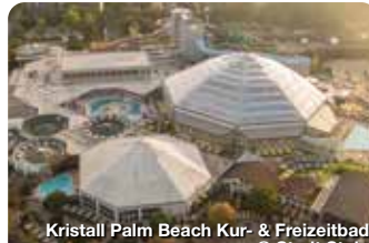
Kristall Palm Beach Kur- & Freizeitbad

Wer an Stein denkt, dem fällt wohl zuerst Faber-Castell ein oder die B14 oder beides. Dabei hat die Stadt, die zwar am südwestlichen Rand Nürnbergs am linken Ufer der Rednitz liegt, aber zum Landkreis Fürth gehört, viel, viel mehr zu bieten. TreffpunktDeutschland.de/rosstal