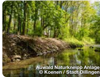
Auwald Naturkneipp Anlage