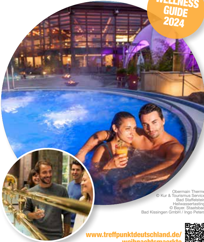
Obermain Therme Heilwassertasting

www.treffpunktdeutschland.de/weihnachtsmaerkte