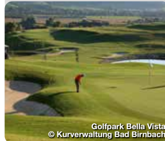
Golfpark Bella Vista

In den Heil- und Thermalbädern Bad Füssing, Bad Griesbach, Bad Birnbach, Bad Gögging und Bad Abbach findet man die richtige Balance zwischen Gesundheit, Entspannung und ganzheitlichem Vital- und Aktivurlaub. Das niederbayerische Umland zeichnet sich durch die höchste Golfplatzdichte Deutschlands aus, mit der Gemeinde Bad Griesbach als dem größten zusammenhängenden Golf-Resort Europas. Die abwechslungsreiche Region bietet als ideale Ergänzung dazu geschichtsträchtige Einblicke in das Herz alter Dom- und Herzogstädte wie Passau, Landshut, Straubing, Dingolfing und Landau. Sie verbinden überliefertes Kulturgut mühelos mit zeitgenössischer Lebensart. TreffpunktDeutschland.de/bayerisches-golf-thermenland