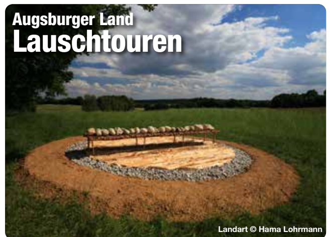
Landart © Hama Lohrmann

Mit dem Audioguide auf den Spuren großer Persönlichkeiten wandern und dabei spannende Erlebnisse und unterhaltsame Geschichten hören. Alles was Sie dafür benötigen ist die kostenlose Bayerisch-Schwaben-Lauschtour App. Mit dem GPS werden die Lauschpunkte automatisch abgespielt – gehen Sie die Tour also in Ihrem eigenen Tempo. Unser Tipp: Die Touren funktionieren auch offline. Am besten lädt man die Tour bereits zu Hause im WLAN herunter.