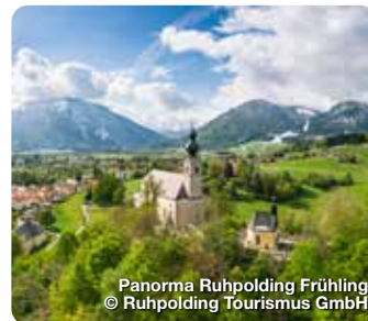
Panorama Ruhpolding Frühling

„Zeit für Dich. Raum für Deine Träume.“ Mit diesem Slogan wirbt das Fürthermare in Fürth um seine Gäste. Raum für Träume gibt es tatsächlich mehr als genug, Badespaß nicht minder. Wenn in der warmen Jahreszeit das Sommerbad öffnet und damit das Angebot der Erlebnistherme mit ihren vielen Facetten erweitert, dann stehen den Besuchern sogar mehr als 4.000 Quadratmeter Wasserfläche zur Verfügung. Zuletzt wurden im März 2022 die neue „Hacienda los Sueños“, ein großzügiges Ruhehaus im mallorquinischen Stil, sowie die Eventaufguss-Sauna „Casa Grande“ mit bis zu 100 Plätzen eingeweiht. Scherbsgraben 15, Fürth