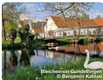
Bleicheinsel Gundelfingen