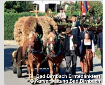
Bad Birnbach Erntedankfest