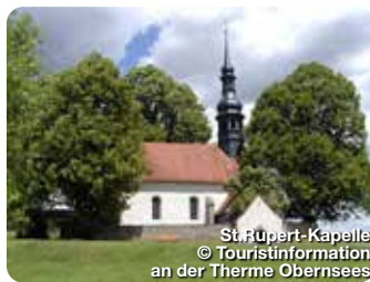
St. Rupert-Kapelle

Längst gilt die Therme als mehrfach ausgezeichnete „Perle“ der Fränkischen Schweiz. Das mineralhaltige Thermalwasser kommt aus Urtiefen des Juragesteins. Das Wasser belebt und entspannt zugleich. An der Therme 1, Mistelgau-Obersees