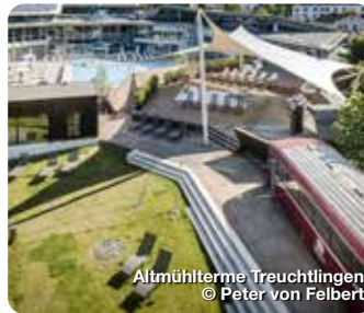
Altmühltherme Treuchtlingen

Quelle purer Lebenslust. Baden und saunieren im wohligen warmen, 18.000 Jahre alten, zertifizierten und staatlich anerkannten Heilwasser nach balneologischen Grundsätzen. Bürgermeister-Döbler-Allee 12, Treuchtlingen