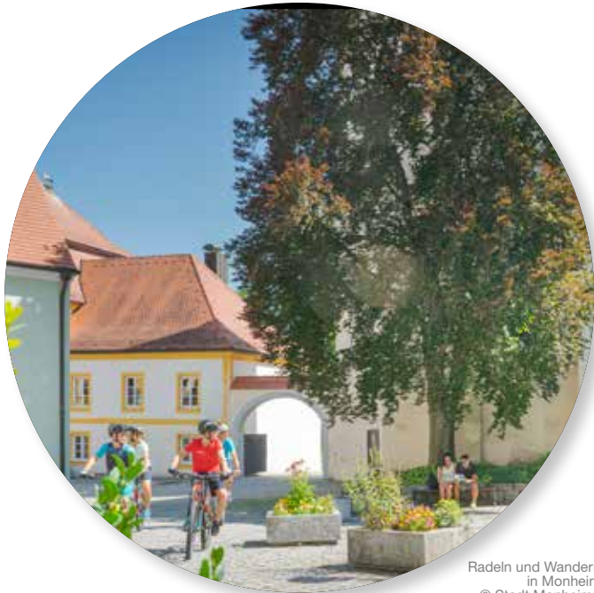
Radeln und Wandern in Monheim