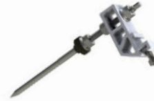
Stockschraube 2.1 Produktnummer: 8024xx

weitere Artikel finden sie in unserem Produktkatalog oder auf unserer Website: www.mounting-solutions.com