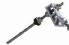
Solarbefestiger 2.1 Produktnummer: 80245x